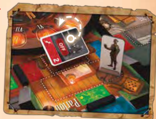
Leroy Johnson dépense une action pour désactiver ce LASER.

Note : certaines cartes ou certains pouvoirs vous permettent de désactiver des pièges à distance. Dans ce cas vous pouvez désactiver un piège même si le professeur est dans la même pièce que celui-ci.